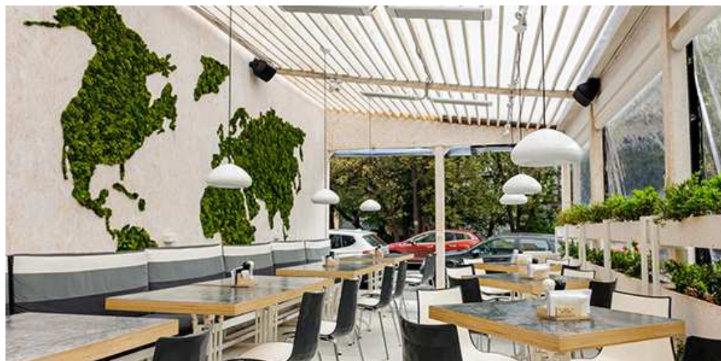
Веранда "Долькабар".

Своим выступлением они разрядили «воздух» и наградили большим творческим позитивом всех тех, кто на прошлой неделе пришел в «Экспострой» на Нахимовском узнать о работе студии Sundukovy Sisters.