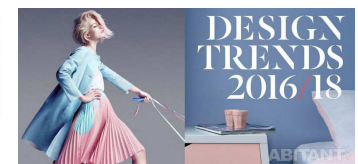
Лекция «Тренды в»